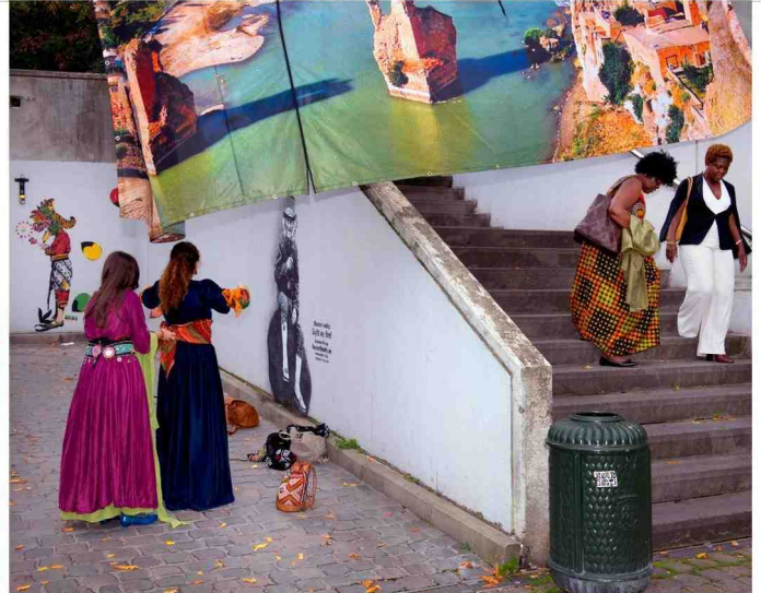
Dit weekend houden de Koerden in Brussel een cultuurfeest. Er is muziek, traditionele kledij en een 'Mesopotamisch' buffet. En er wordt gepraat over de 'revolutionaire bevrijdingsideologie' van de PKK.