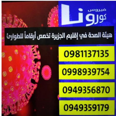
Der noodnummers voor het coronavirus.

De Democratische Federatie van Noord-Syrië heeft sinds 1 maart 2020 de grenspost tussen Irak en Rojava in Faysh Khabur gesloten 4 . De wegen tussen de zones van het regime en Rojava zijn eveneens onder controle. De straten worden gedesinfecteerd en een lock-out werd ingesteld van 23 maart tot en met 21 april. Newroz, het Koerdische Nieuwjaar dat op 21 maart wordt gevierd, is afgelast. Informatiecampagnes werden opgezet onder meer in de vluchtelingenkampen, enerzijds over de toe te passen hygiënische praktijken en anderzijds over de ontwikkeling en de transmissie van het virus. Vier noodnummers zijn beschikbaar. Twee bijscholingscentra werden opgericht voor artsen en verplegend personeel. Ze zijn gelegen in Hasake en Qamîşlî. Om het tekort aan medisch materiaal op te vangen worden beademingstoestellen en maskers gemaakt in het kanton Cêzîreh. Rojava beschikt immers maar over 27 beademingstoestellen 5 . In de komende dagen worden twee centra ingericht om de besmette personen in quarantaine te zetten. Heyva Sor stelt 120 bedden ter beschikking en het gezondheidscomité 200.